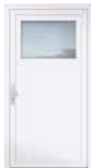
Mindestbreite: 1.100 mm