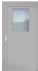
Mindestbreite: 900 mm