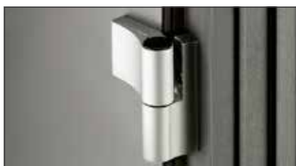
2 zweiteilig, aufliegende Türbänder , dreidimensional verstellbar, in EV1*