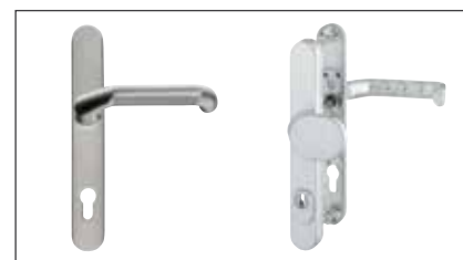
Schutzbeschlag als Drücker- oder Wechselgarnitur in EV1